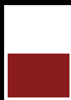
■ 1/2 Seite quer 178 x 130 mm