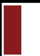
■ 1/2 Seite hoch 87 x 265 mm