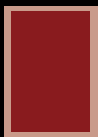
■ 1/1 Seite 210 x 297 mm ■ 1/1 Seite 178 x 265 mm