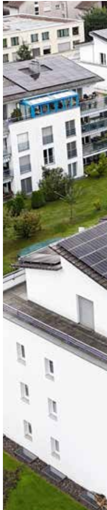
Solaranlage bei der Überbauung Florapark