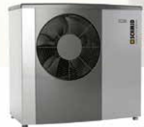
NIBE Wärmepumpe S2125