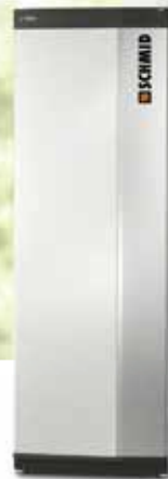
NIBE Wärmepumpe S1255