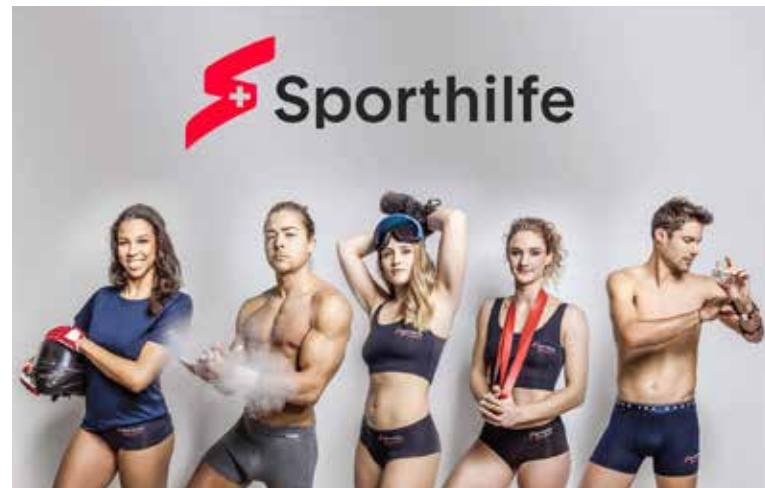
Die Team Suisse-Kollektion ist ein Dauerbrenner.

Selbstverständlich können ISA-Kunden ihre Wäsche individuell gestalten und personalisieren lassen. Auch können